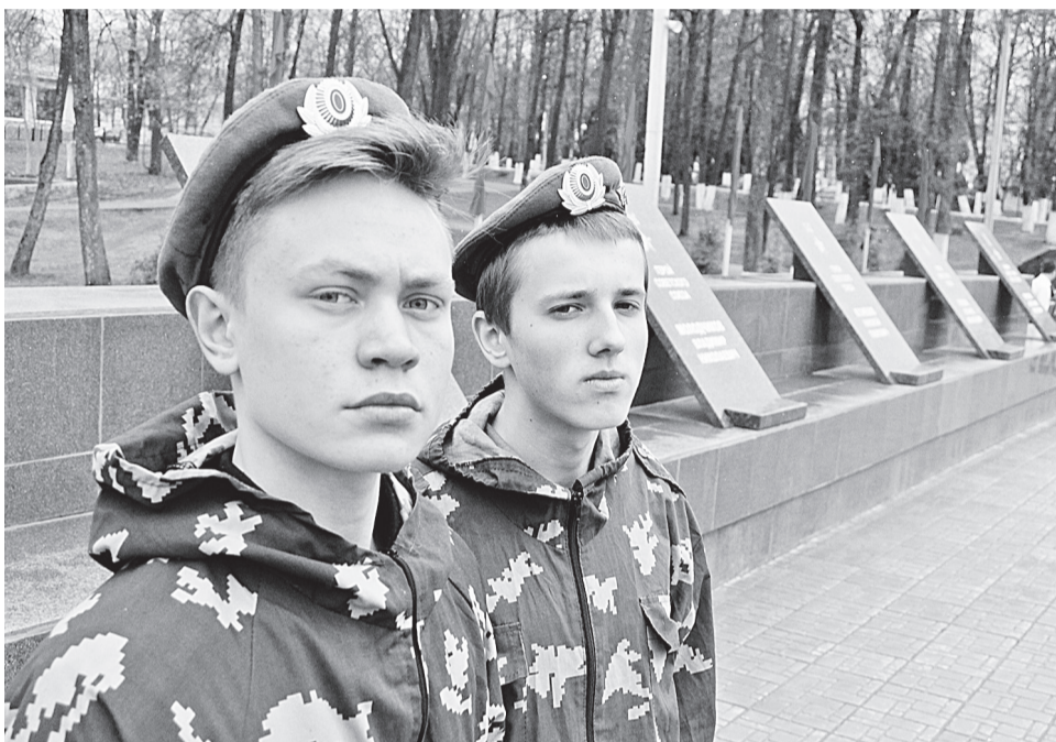
Студенты Боровичского техникума строительной индустрии и экономики у Вечного огня