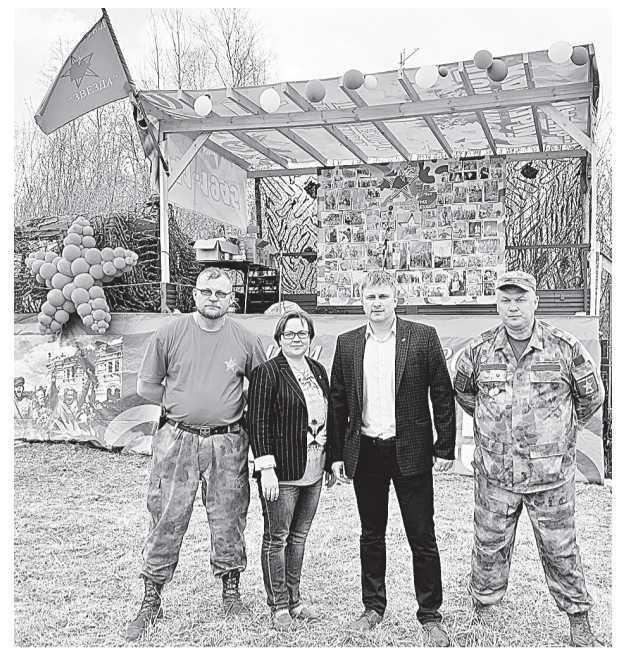
Сила — в единстве!